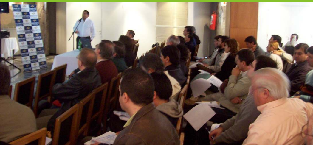
Presentación y entrega del material promocional a autoridades departamentales.

Más de 5.000 folletos, un video institucional que habla de todo lo que se puede hacer en el departamento, spots televisivos, una página web para acceder a servicios y conocer las oportunidades que brinda esta zona cordillerana, 5000 postales, más 800 libros de promoción turística; son las nuevas herramientas comunicacionales con las que cuentan los iglesianos para promocionar el turismo departamental.