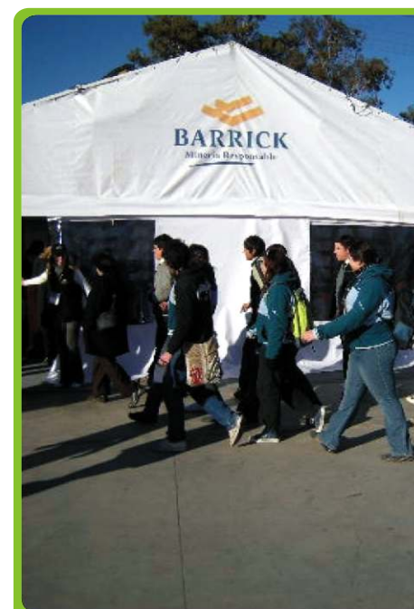
Ingreso al stand de Barrick en la feria minera

vacantes- y otro particularmente atractivo y de corte didáctico para estudiantes de 4°, 5° y 6° año del nivel secundario, quienes pudieron conocer más sobre la minería en general y de las actividades de Barrick en San Juan.