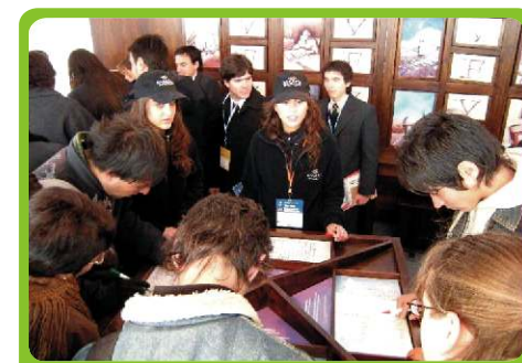
Visitantes y nuestras promotoras en el stand

17 escuelas de la provincia lo conocieron y se informaron de las actividades de la compañía. El Stand de Barrick en la feria minera permitió el contacto directo con personal del área de Reclutamiento (RRHH) de la empresa -a fin de poder asesorarse sobre la posibilidad de ingresos y puestos