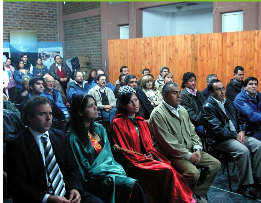
Acto de presentación y entrega de material para la campaña de promoción turística