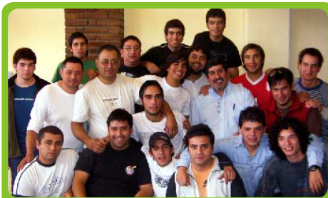
Los nuevos profesionales

Diecinueve jóvenes sanjuaninos podrán trabajar a prueba y durante 3 meses en Veladero, luego de que finalizaran recientemente con éxito una nueva edición del Programa de Mantenedores de Equipo Pesado. Esta iniciativa, muestra del compromiso de la empresa con su política de privilegio a la contratación de mano de obra local, se integra dentro de los planes de capacitación laboral que la compañía minera lleva adelante en San Juan. Los egresados, que ahora podrán mejorar sus habilidades profesionales gracias al entrenamiento que les brindarán instructores especializados, cumplieron con un exigente programa de capacitación y selección, además de superar todos los exámenes teóricos.