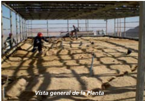
Vista general de la Planta

Nuestra compañía es la pionera en el sector minero en la implementación de un inusual tratamiento de aguas servidas, que tiene como principal elemento voraces lombrices, las que cumplen un rol fundamental en el proceso.