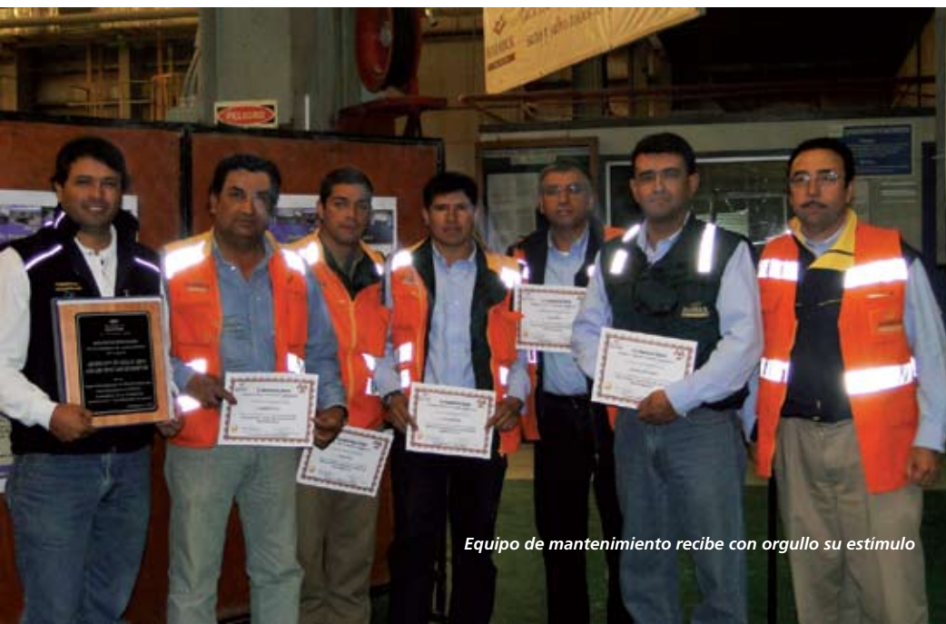
Equipo de mantenimiento recibe con orgullo su estímulo

De esta forma, nuevamente los trabajadores de Barrick Zaldívar demostraron su interés con la cultura de mejorar continuamente, donde se fusionan las buenas ideas con el apoyo de nuestra compañía.