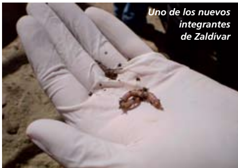
Uno de los nuevos integrantes de Zaldívar