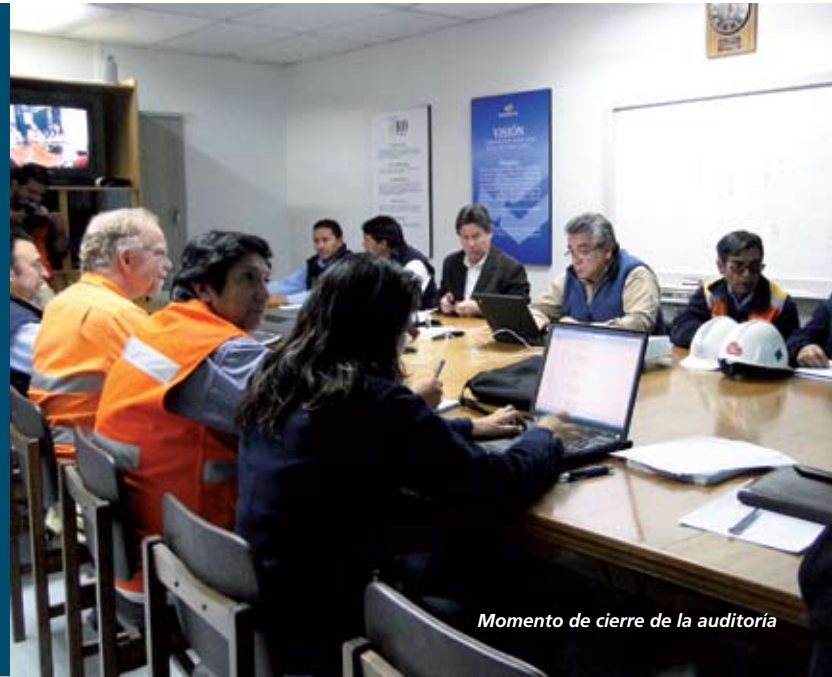
Momento de cierre de la auditoría

En la oportunidad, también se evaluó la incorporación de energías renovables no convencionales, como la energía solar. Además se hizo una invitación a todos nuestros trabajadores a proponer proyectos relacionados con el tema, pues nuestra compañía mantiene un fuerte compromiso con el Medio Ambiente y busca promover las buenas ideas.