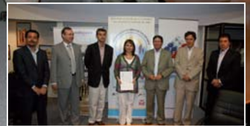
Compromiso firmado por una ciudad saludable

El compromiso de integrar a Antofagasta como ciudad promotora de salud, se enmarca dentro del programa de Ciudades Saludables de la Organización Mundial de la Salud, desafío importante a lo que la Alcaldesa señala "si nosotros no podemos nadie lo