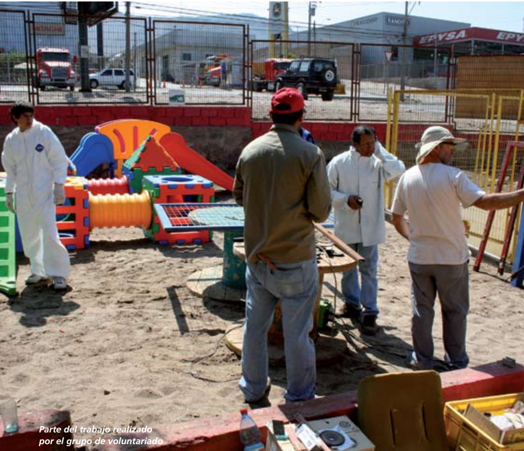
Parte del trabajo realizado por el grupo de voluntariado

Desde el año pasado, la Agrupación de Trabajadores Pro-Ayuda "Antonio Franco" de nuestra compañía se encuentra realizando trabajos significativos para el Jardín Infantil "Sirenita" de Antofagasta dependiente de la JUNJI, con la finalidad de entregar una mejor calidad en la educación a los menores que allí son atendidos.