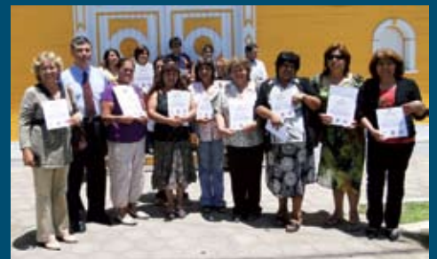
Microempresarios de Taltal reciben certificado

La capacitación concluyó con una favorable evaluación a los alumnos, además de la entrega de certificaciones y una placa recordatoria para instalar en sus futuros negocios simbolizando, con esto, el esfuerzo constante para lograr sus metas.