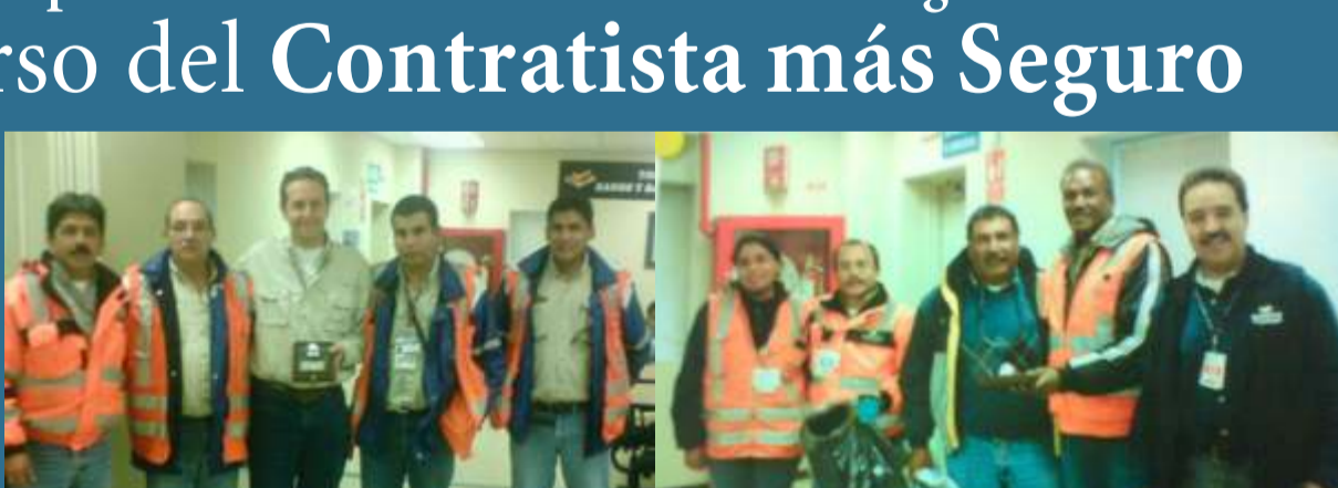
Las empresas Sodexo y Chan Chan, por sus buenas prácticas de seguridad.

¡Felicitaciones a todo el personal de Sodexo y Constructora Chan Chan por este logro!