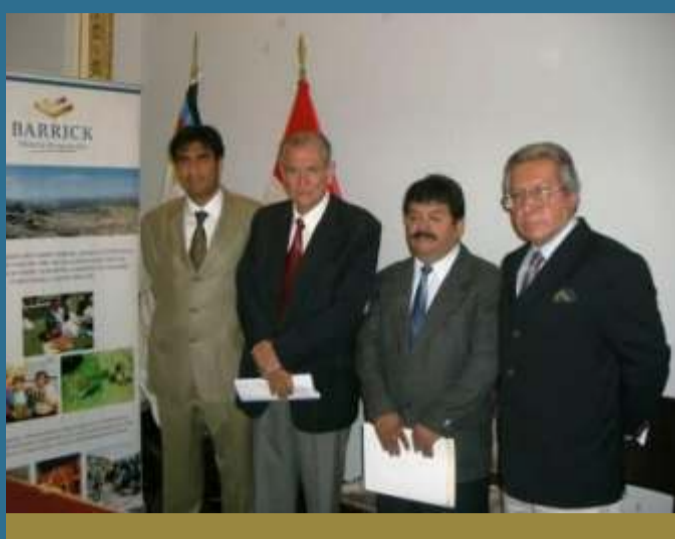
Funcionarios de Barrick y máxima autoridad de la región firmaron acuerdo para combatir la desnutrición infantil

Integración y respeto cultural con las comunidades