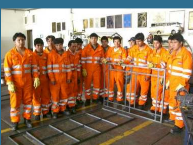
Grupo participantes del primer taller de Carpintería Metálica

Esto es bueno para nosotros porque podemos poner un taller y hacer una empresa de repente. Estamos muy contentos con Barrick por darnos esta oportunidad."