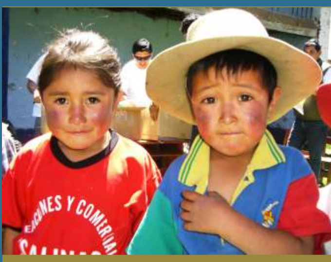
La desnutrición es grave mal que afecta a los niños de la región

Es necesario señalar que los fondos del Aporte Voluntario de Barrick están siendo invertidos en un gran número de proyectos, beneficiando a las poblaciones de las zonas de influencia de la operación minera, que sin duda, constituyen grandes oportunidades para incentivar los mecanismos necesarios para al desarrollo sostenible de la región.