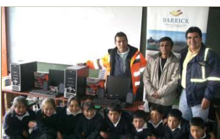
Los equipos donados servirán para mejorar la calidad educativa de los niños de Quiruvilca

La adquisición de las computadoras fue posible gracias a los fondos obtenidos de la venta de papel reciclado a una empresa comercializadora de residuos sólidos. Es necesario resaltar el esfuerzo y compromiso de todos los trabajadores de Barrick, quienes concientizan de las buenas prácticas ambientales de la compañía, colaboraron con la recaudación y adecuada disposición de estos residuos, en su respectiva área laboral.