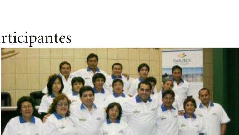
Los representantes de las empresas comunales de Lagunas Norte participaron con mucho entusiasmo.

Estos entrenamientos forman parte del programa de Desarrollo de Oportunidades Estratégicas y tienen como propósito desarrollar y fortalecer aptitudes como el liderazgo en las principales líderes de las organizaciones, a través del desarrollo de factores clave como motivación, trabajo en equipo, manejo de situaciones bajo presión, entre otros; orientados a la certera toma de decisiones, con una correcta guía del personal a su cargo. De igual manera, se espera la adopción del liderazgo y motivación en sus entornos familiares y el desempeño como buenos líderes de opinión en sus comunidades.